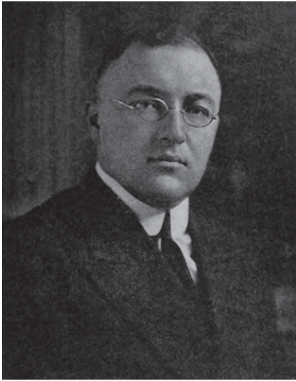
Boris Alexandrowitsch Bachmietjew (A.J. Sack, The Birth of the Russian Democracy , New York 1918)